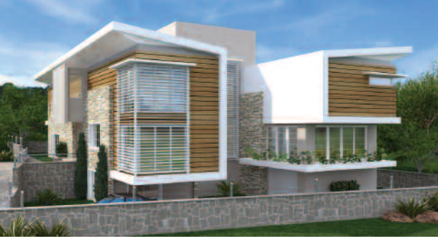
ÜSTTE S-S evi, Bornova