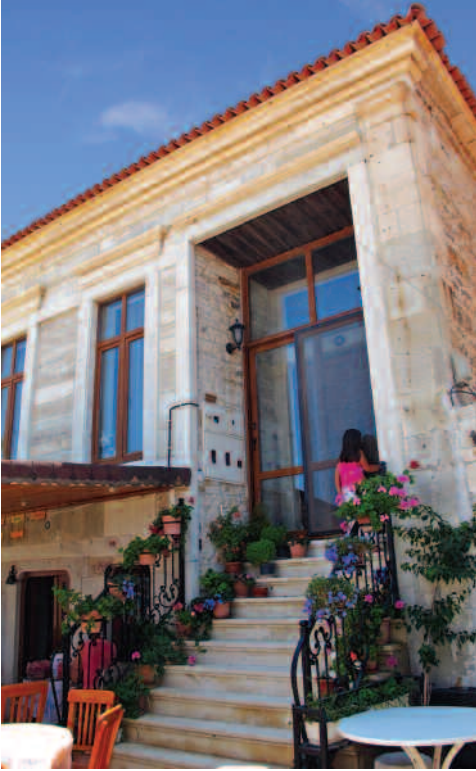
Ayşe Hekimoğlu Evi (Yeni Foça)

İZMİR BÜYÜKŞEHİR BELEDİYESİ'NİN KENTTEKİ TARİHİ YAPILARIN KORUNMASINI TEŞVİK AMACIYLA BU YIL 9. KEZ DÜZENLEDİĞİ "TARİHE SAYGI ÖDÜLÜ", İZMİR'DEKİ TARİHİ VE KÜLTÜREL MİRASA SAHİP ÇIKAN 18 KİŞİ VE KURULUŞA VERİLDİ