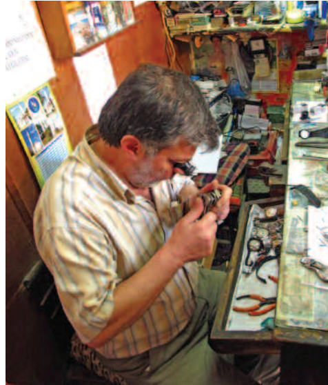
Mehmet Erol Saatçi Dükkanı (Urla)

Tarihe Saygı/ Yerel Koruma Ödülleri, binlerce yıllık kültür geleneğinin biriktiği bir coğrafya üzerinde, bu uygarlıklara ait çeşitlenmiş ve farklılaşmış kültürel-mekânsal mirasa hak ettiği saygının gösterilerek