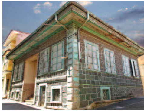
Hediye Karaoğlu Evi (Basmane)