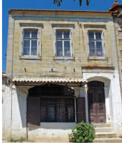
Nazime Yıldız Evi (Yeni Foça)

Jüri üyelerinin yaptığı değerlendirme sonucu ödüle değer görülen çalışmalar şöyle: