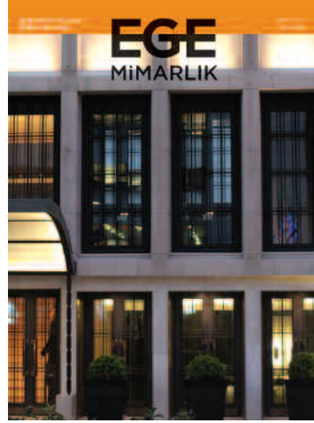
KAPAK Key Butik Otel