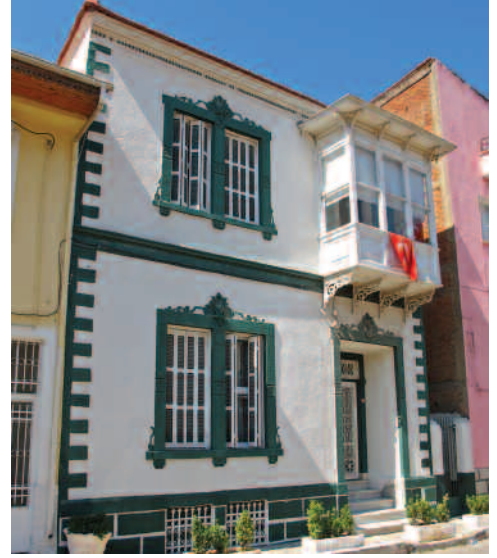
Nesrin & Nesli Kir Evi (Buca)