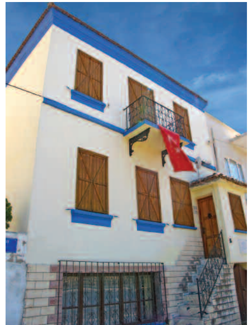
Şükrü Özkaynak (Başöğretmen Cemal Özkaynak Selçuk Anı Evi)