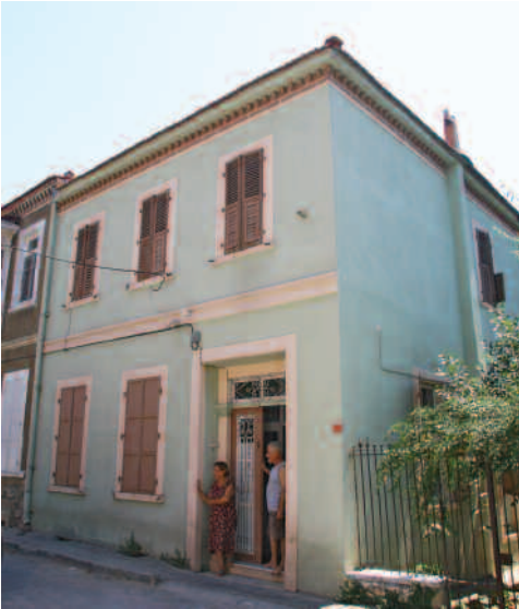
Mediha Tuğman Evi (Buca)