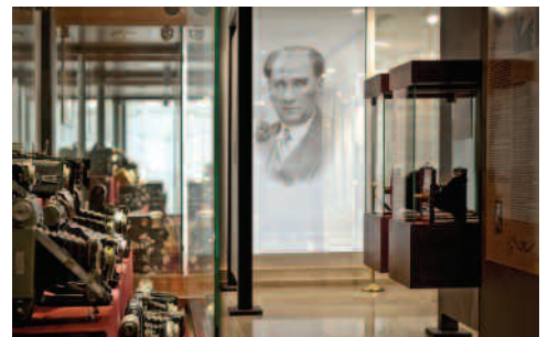
Karşıyaka Belediyesi Hamza Rüstem Fotoğraf Evi